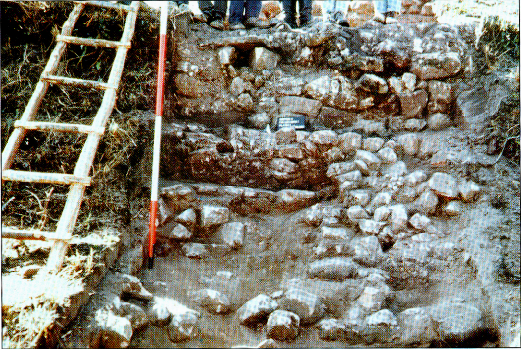
Restos oseos y fragmentos de cerámica inca

N-S. Ambos quitan función a tallados previos.