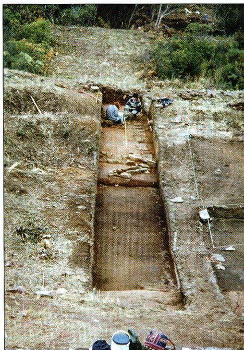
Trabajos de excavación

Se debe hacer un camino más transitado y mejorar los servicios, sobre todo dada la importancia turística para un pueblo que puede vivir de ello.