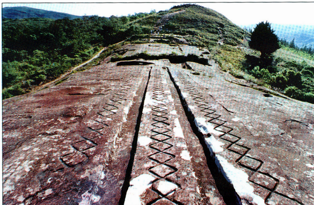
Parte superior de la parte esculpida

“Sabaypata” como una de las fortalezas de la expansión inca hacia el oriente. En 1595-1605, la “Relación” del Padre Diego Felipe de Alcaya, menciona la fundación, por parte del inca Wankané, de un pequeño reino de frontera entre Collasuyo y Antisuyo “El Fuerte”, en tierras de dominio Chané (lo que puede indicar que este grupo era originario en el sitio) y en alianza con su cacique Grigotá; Wankané según la fuente, “subió al asiento de Sabaypata donde asentó su Real” (indicando que ya existía un asentamiento previo), allí residió con su corte incluyendo 2000 Mamakunas. Se mencionan varios ataques por parte de los chiriguano a quienes finalmente llevaron prisioneros al Cuzco, donde Wayna Kapac los habría sacrificado desnudos en las cumbres de la capital (tal vez de allí el nombre de chiriguano o “muerto de frío” en quechua).