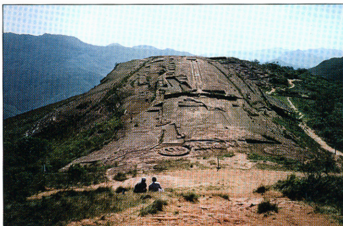
Vista de la roca desde el oeste

Aquí se albergan flora y fauna importantes citadas por naturalistas, como Tadeo Haenke, que en su Plantae Samaipatiense , incluye un dibujo, el primero que existe de una orquídea boliviana; Theodor Herzog que reporta la Puya Nana; Cárdenas y Vásquez que hablan de taxas nuevas de especies endémicas en la zona. De igual forma, el estudio de Herpetofauna habla del