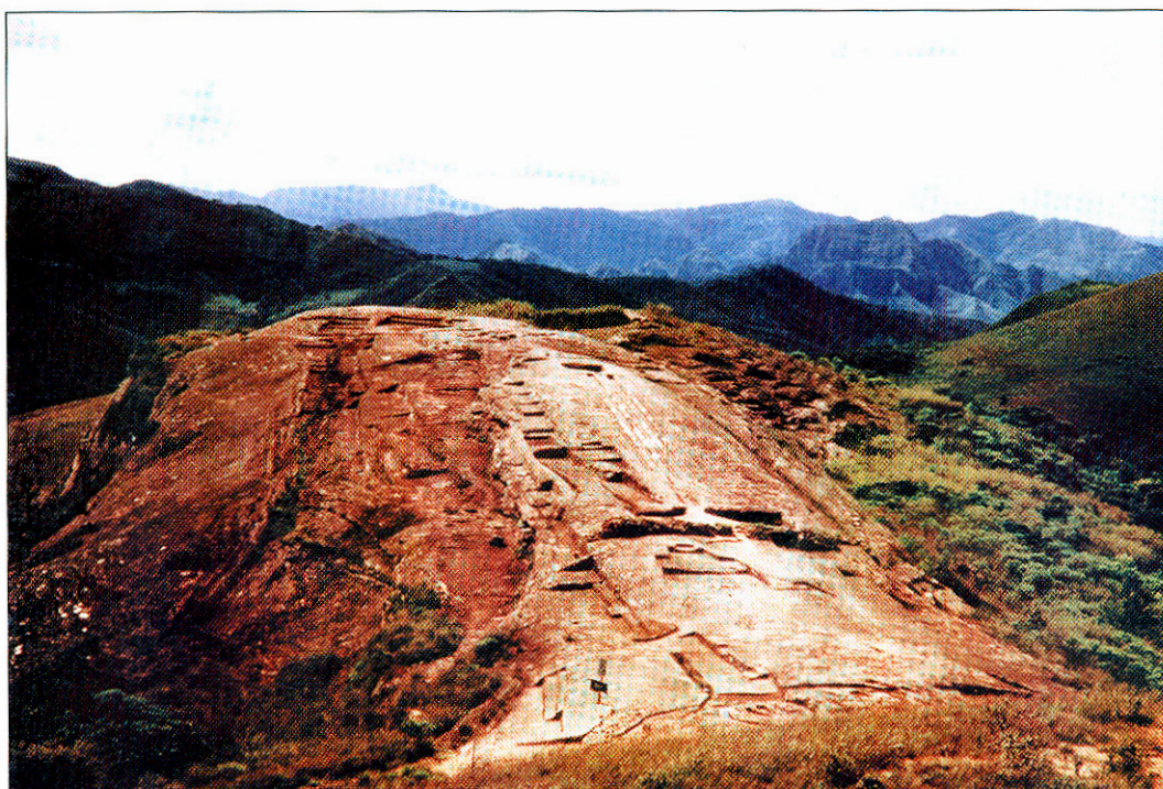
Cresta de la roca esculpida

capítulo más importante que iluminará la historia de Samaipata.