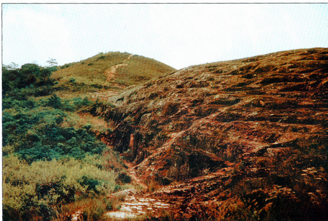
Parte baja de la roca esculpida

solo en eje, sino en los motivos geométricos rectilíneos, incisos poco profundos, por lo que se piensa servía para hacer correr líquidos livianos (sin partículas sólidas), el serpenteo y efecto de retén, apuntan a que se trataba de un líquido ceremonial. Al principio y fin se encuentran piscinas colectoras, recordando por su semejanza (Rivera, 1979) a la Pajcha o recipiente de madera, utilizado para libar a sorbos bebidas alcohólicas