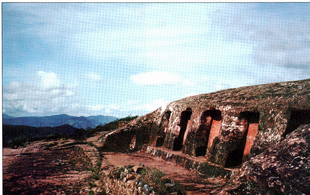
Hornacinas del sector norte